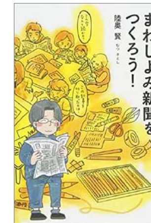
3・7 講目の講師著書